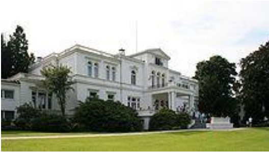
① Villa Hammerschmidt, Bonn