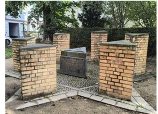
③ Denkmal auf dem Synagogenplatz, Beuel-Mitte

Im Bonner Stadtbezirk Beuel erinnern 84 Stolpersteine sowie mehrere Gedenksteine und Tafeln an das Schicksal ermordeter und verfolgter jüdischer Mitbürger, Zwangsarbeiter und anderer Regimegegner des Nationalsozialismus.