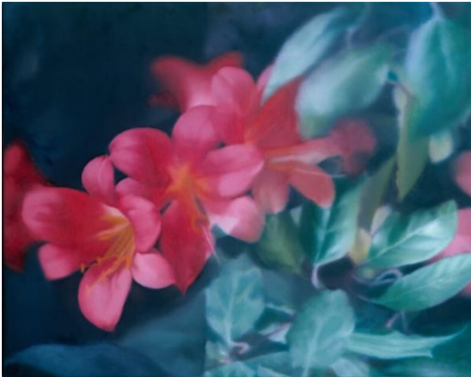
④ Gerhard Richter, Blumen, 1977. Öl/Lw., 40 x 50 cm

Die rund 120 Werke, die in der umfassendsten Gerhard-Richter-Ausstellung in Deutschland seit 10 Jahren gezeigt werden - der Schwerpunkt liegt auf der Gattung Malerei - stammen zum großen Teil aus Privatsammlungen und wurden zuvor selten oder sogar noch nie in der Öffentlichkeit gezeigt. Der Blick wird gelenkt auf das Rheinland als ein ideales Umfeld, in dem sich das Werk von Gerhard Richter entfalten konnte, und gibt Einblick in das gesamte Spektrum seiner Kunst von den frühen 1960er Jahren bis in die Gegenwart. Zu sehen sind Gemälde, Zeichnungen, Aquarelle, Fotografien und Skulpturen sowie der einzige von Gerhard Richter gedrehte Künstlerfilm.